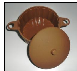
▲シリコンスチーマー