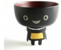
▲わんこきょうだい椀 ※写真はイメージです

応募コースは 2 つ。キャンペーン期間中にお出かけした「いわてクールシェアスポット」を書いて応募すると、抽選で QUO カード(500 円分)が当たる「クールシェア・コース」と、ご家庭の電気使用量(今年 7 月分または 8 月分と前年同月分)を記入して応募すると、前年より消費電力が削減できた方に、抽選でわんこきょうだい椀(岩手県産漆を使用した汁椀)が当たる「チャレンジ・コース」があります。