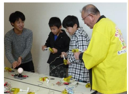
▲岩手大学さんによる体験教室コーナー