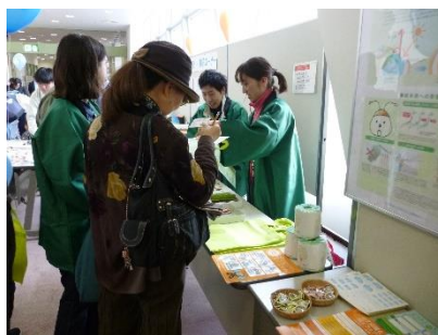
▲屋内でのパネル展示&温暖化アンケートコーナー