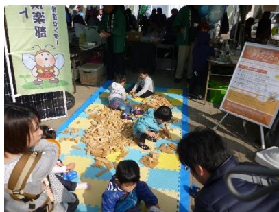
▲外テント展示&体験コーナー

当日は、太陽光エネルギーを活用した木工工作や漁師彫りによる一本彫り実演、県産間伐材を使ったつみ木や発電体験コーナー、岩手大学の学生によるミニカー等の発電体験教室や、地球温暖化・気候変動に関するDVD上映・パネル展示など、盛り沢山の内容でお届けし、2日間で約1,400人の方にご来場いただきました。