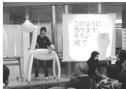
手書き要約筆記表示の様子