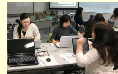
養成講習会（パソコンコース）