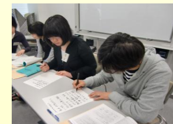
養成講習会（手書きコース）