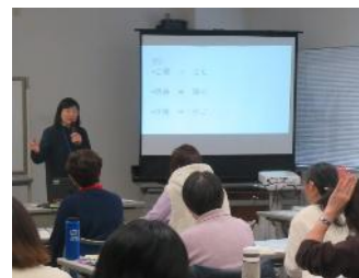
要約筆記(筆談)の体験