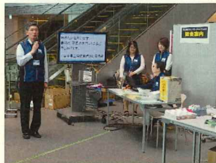
パソコン要約筆記表示の様子