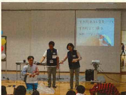
手書き要約筆記表示の様子